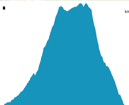
PROFIL DE DÉNIVELÉ