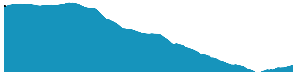
PROFIL DE DÉNIVÉLÉ