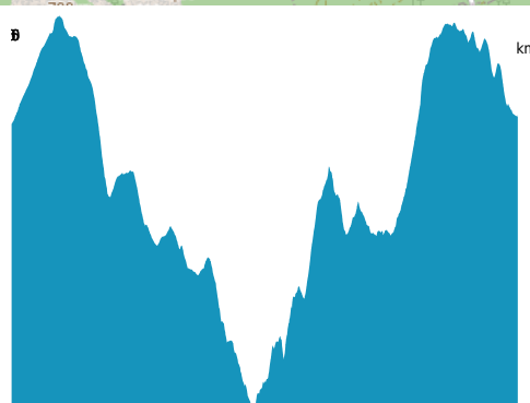
PROFIL DE DÉNIVELÉ