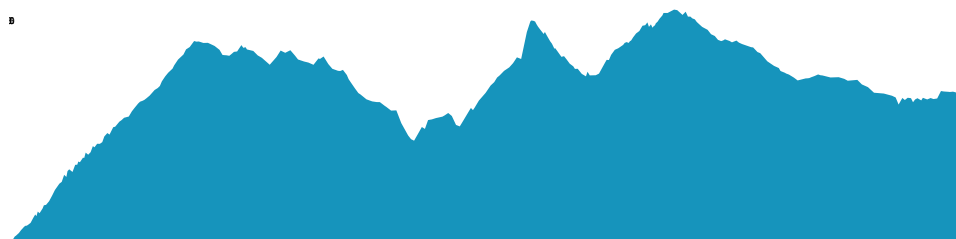
PROFIL DE DÉNIVÉLÉ