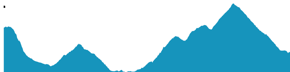
PROFIL DE DÉNIVELÉ