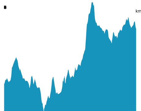
PROFIL DE DÉNIVELÉ