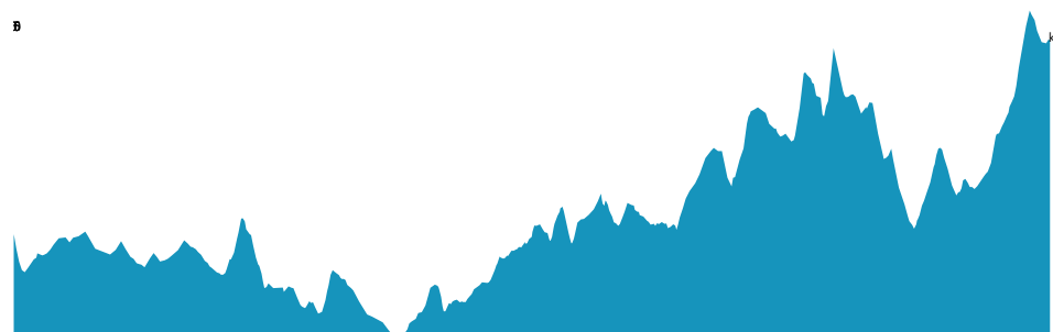
PROFIL DE DÉNIVELÉ