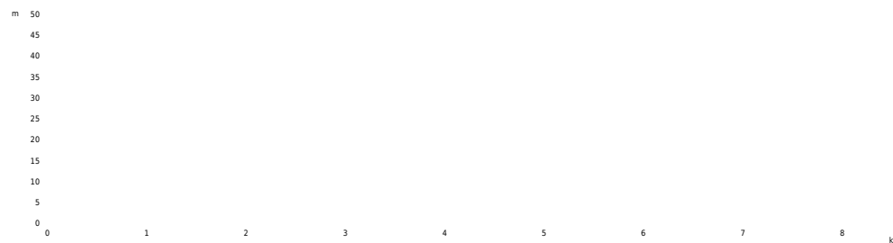
PROFIL DE DÉNIVÉLÉ