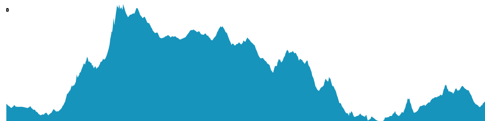
PROFIL DE DÉNIVÉLÉ