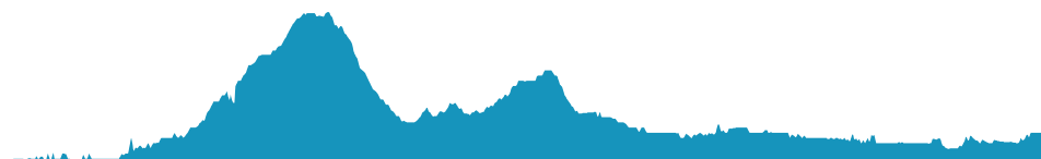
PROFIL DE DÉNIVÉLÉ