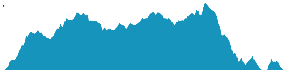
PROFIL DE DÉNIVÉLÉ