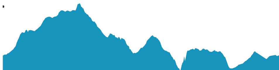
PROFIL DE DÉNIVELLÉ