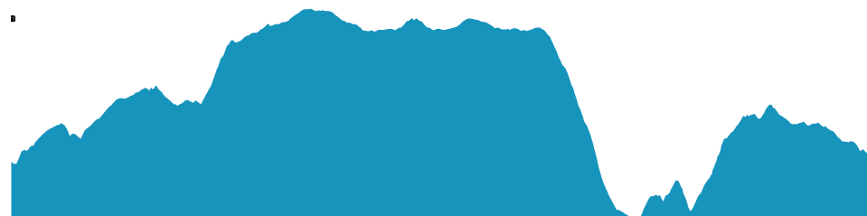
PROFIL DE DÉNIVELÉ