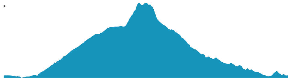
PROFIL DE DÉNIVÉLÉ