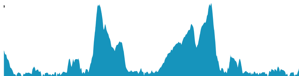
PROFIL DE DÉNIVELÉ