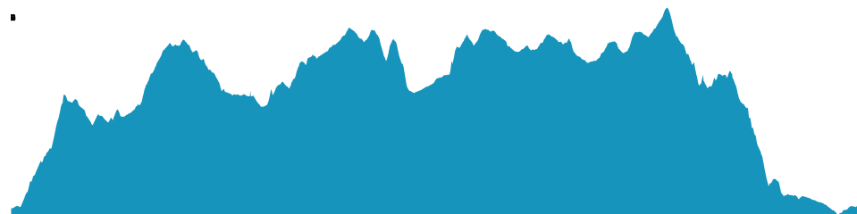
PROFIL DE DÉNIVÉLÉ