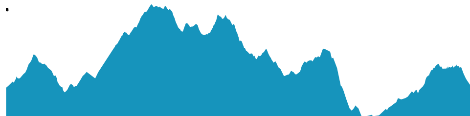
PROFIL DE DÉNIVELÉ