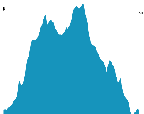
PROFIL DE DÉNIVELÉ