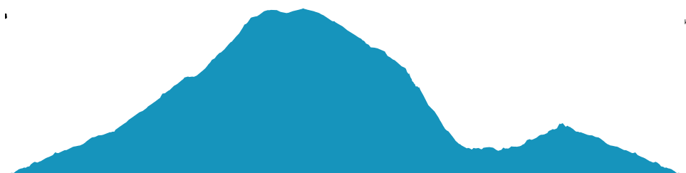
PROFIL DE DÉNIVÉLÉ