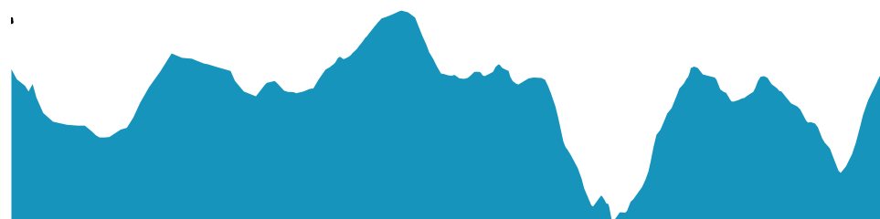
PROFIL DE DÉNIVÉLÉ