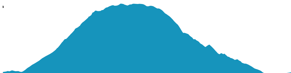
PROFIL DE DÉNIVÉLÉ