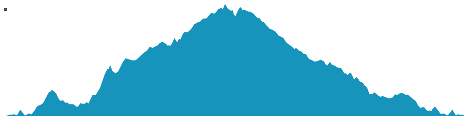
PROFIL DE DÉNIVÉLÉ