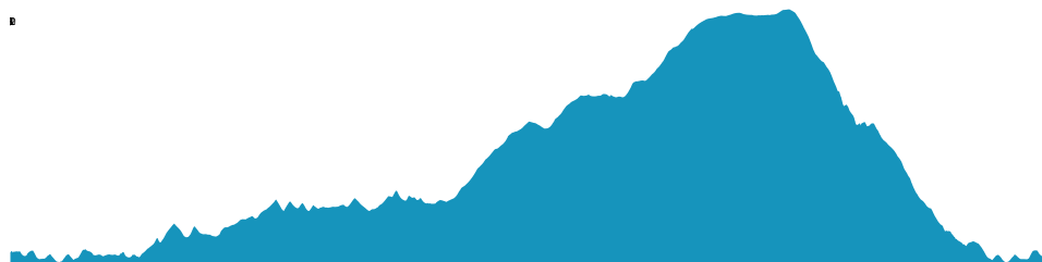
PROFIL DE DÉNIVÉLÉ