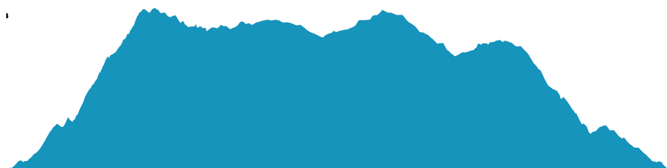
PROFIL DE DÉNIVÉLÉ