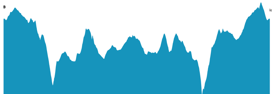
PROFIL DE DÉNIVELÉ