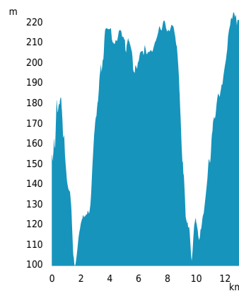
PROFIL DE DÉNIVÉLÉ