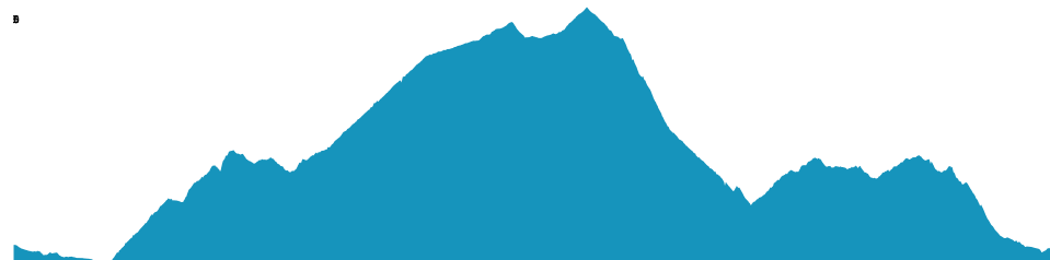
PROFIL DE DÉNIVÉLÉ