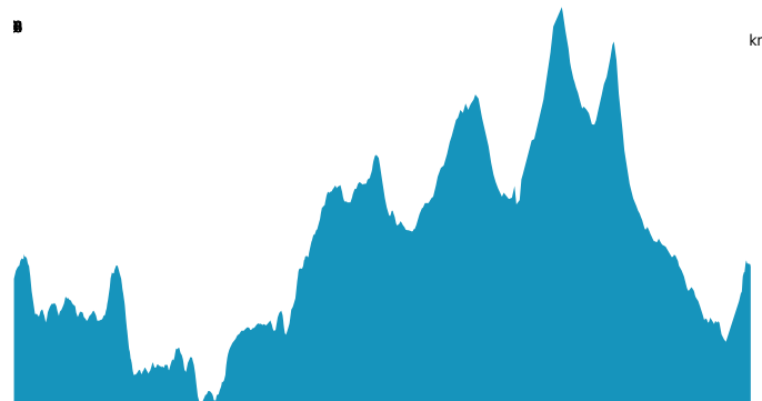
PROFIL DE DÉNIVELÉ