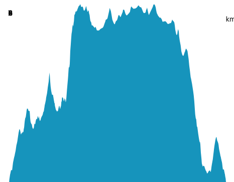
PROFIL DE DÉNIVELÉ