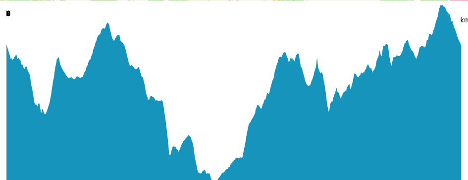
PROFIL DE DÉNIVÉLÉ