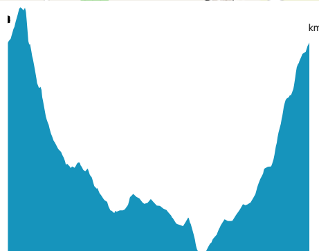
PROFIL DE DÉNIVÉLÉ