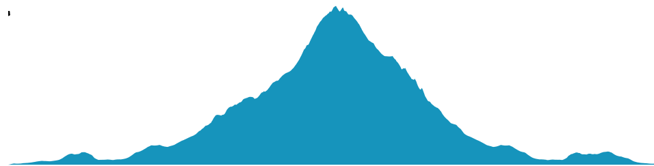
PROFIL DE DÉNIVÉLÉ