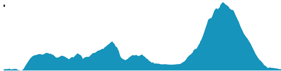
PROFIL DE DÉNIVELÉ