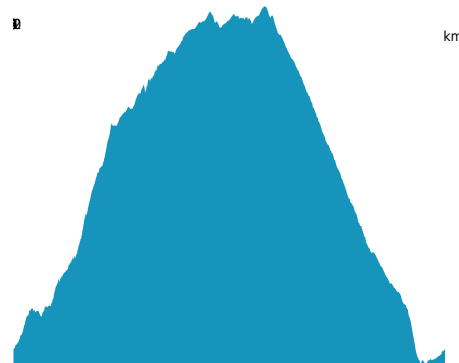
PROFIL DE DÉNIVELÉ