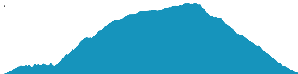
PROFIL DE DÉNIVELÉ