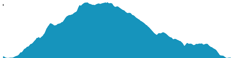
PROFIL DE DÉNIVELLÉ