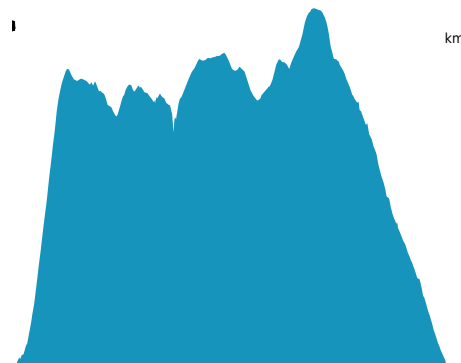
PROFIL DE DÉNIVELÉ