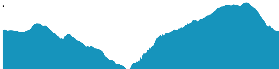
PROFIL DE DÉNIVELÉ